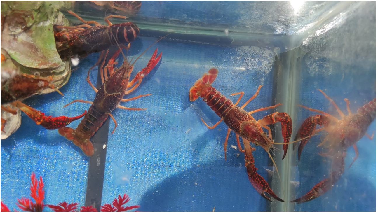
lezione sui gamberi con acquario portatile