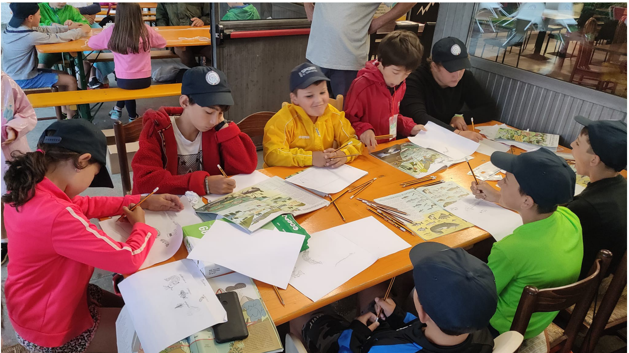
nella foto sopra: i ragazzi impegnati a disegnare i pesci conosciuti nel corso

Giornata PescaGiovani: invito gratuito a metà maggio per tutti i ragazzi 0-15 anni di pesca per l'intero pomeriggio per la promozione delle attività di pesca e sport correlato (tiro al bersaglio, lancio tecnico, lancio pastura su prato). Distribuzione delle magliette o cappellini omaggio della manifestazione. A questa giornata sono