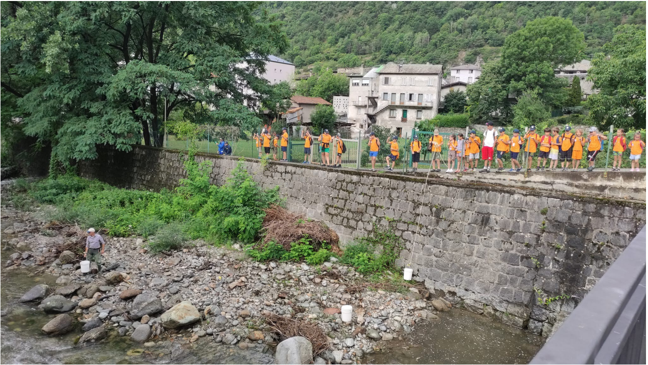
a scuola di guardiapescca: si osserva da vicino il lavoro delle guardie