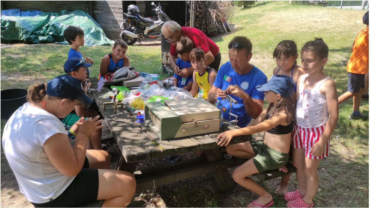
laboratorio di costruzione di mosche artificiali con materiali di recupero