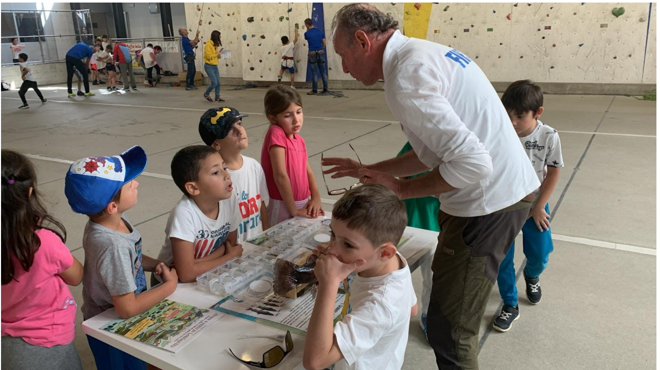
lezioni ambientali in palestra (giornata dello sport Tirano 2024)