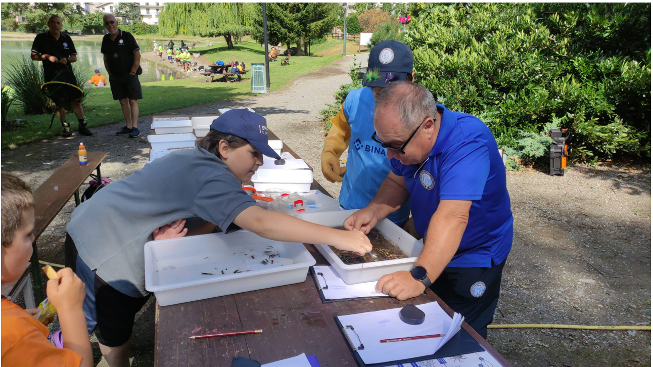
classificazione degli insetti acquatici dal vero con istruttore entomologo