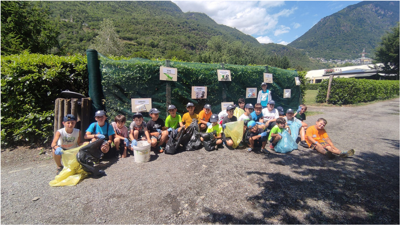
nella foto sopra: di rientro dal pomeriggio ecologico davanti al pannello rifiuti