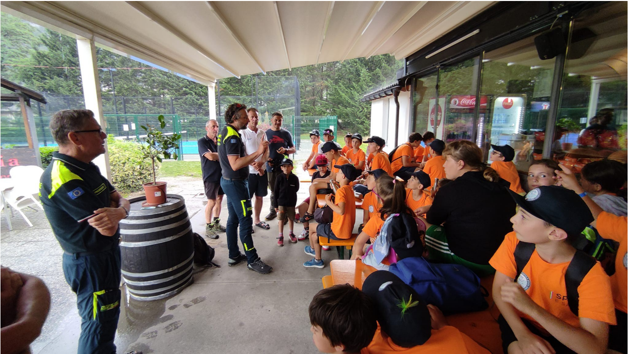
incontro con protezione civile ai ragazzi dei campi estivi