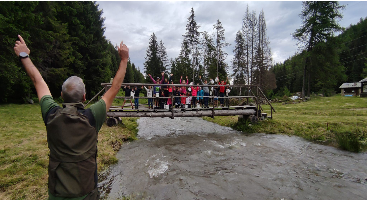
ripopolamento del torrente con le giovani trotelle nate al centro ittico da parte di un grest estivo dopo la lezione preventiva