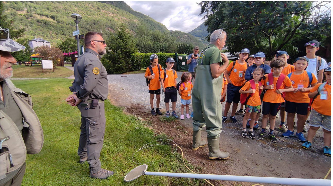
incontro con le guardie di UPS Sondrio prima dell'uscita sui torrenti